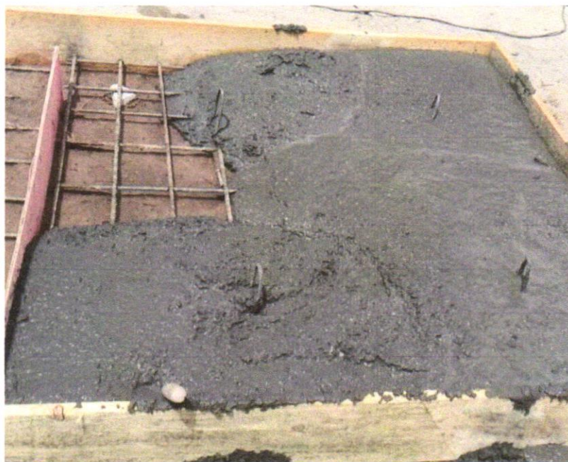
Foto 05 - CONCRETO