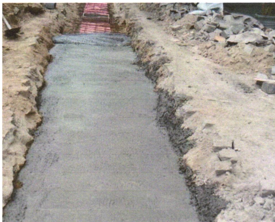
Foto 06 - CONCRETO