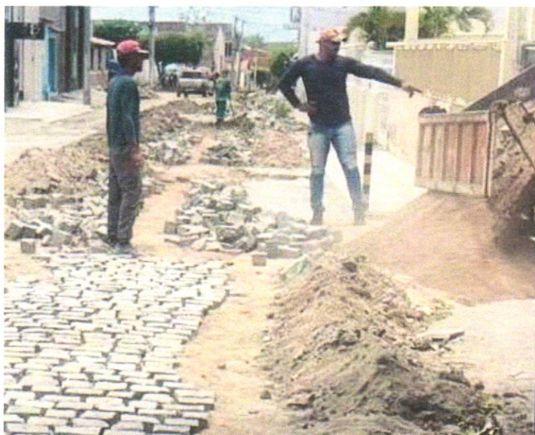
Foto 03 - ATERRO MANUAL COM SOLO ARGILLO-ARENOSO IMPORTADO E COMPACTAÇÃO MECANIZADA EM CAMADAS DE 0,20 M NO MÁXIMO